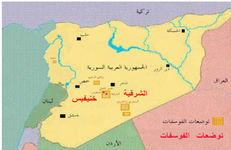
شکل (۳): نقشه معادن فسفات سوریه

تنی است ۱ . از طرف دیگر، روسیه می‌خواهد برای رساندن فسفات‌های استخراج‌شده از معادن یادشده، راه آهنی از شرق سوریه و از محل این معادن به بندر طرطوس که اجاره کرده است راه‌اندازی کند. نقشه زیر نقشه معادن سوریه است.